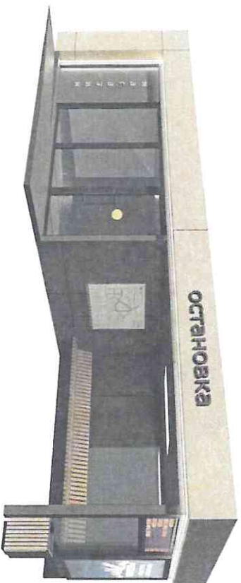
Видовые точки остановки в г. Лобня

заборутные размеры: 8,4м x 3,4м x 3м (высота) размеры внешние торговой точки: 4,7м x 3,4 м, S 13 м 2