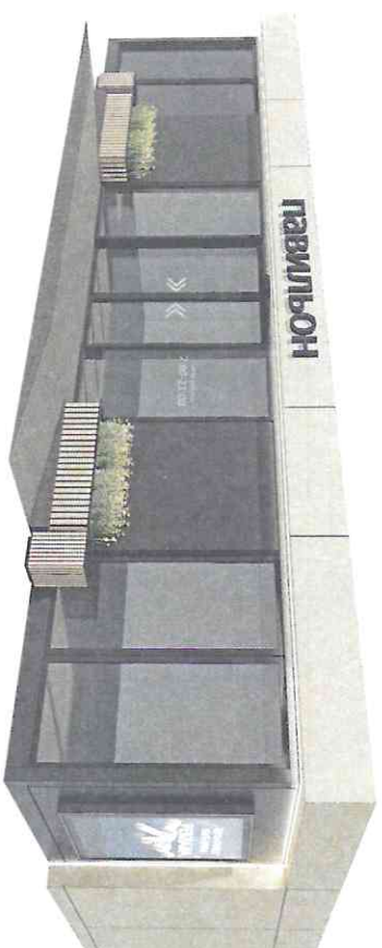
Видовые точки павильона в г. Лобня

габаритные размеры: 10,6м x 5,5м x 3,3м (высота) площадь торгового зала 50 м 2